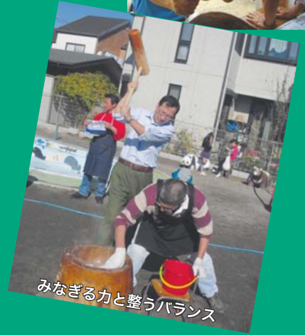
みなぎる力と整うバランス

吉田つとむ マルチメディア双方向発信 http://www.youtube.com/yoshidaben