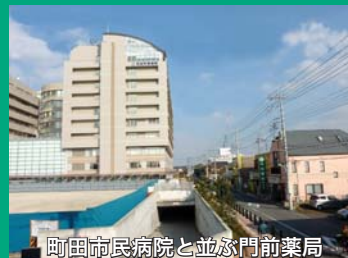
町田市民病院と並ぶ門前薬局

国政では、今回の「事業仕分け」作業で、特許が切れた先発医薬品の薬価を引き下げる判断が下されました。町田市を医療費軽減の先進都市にすべく取り組んでまいります。