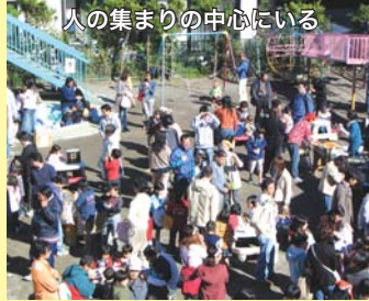
人の集まりの中心にいる