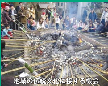
地域の伝統文化に接する機会

2025年開通するJR東海リニア新幹線は、相模原市内に地下駅を予定しています。待望の小田急多摩線や多摩都市モノレールの延伸。LRT（低床式高速路面電車）や新都市交通の導入など、相模原市と一体となり、町田市がよりリードしたスタンスで充実した地域の総合交通網をめざします。コミュニティバス、タクシーとの連携もスムーズにさせます。