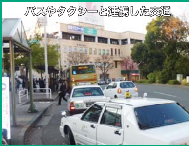
バスやタクシーと連携した交通