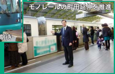
モノレールの町田延伸を推進