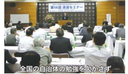
全国の自治体の勉強を欠かさず

行政のスリム化を求める立場から、議会と議員が先行する政治スタンスが必要です。議員の定数や報酬の削減を率先して行うことを提唱します。さらに、市民の税を減すことを地方政治の課題としていきます。