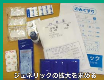
ジェネリックの拡大を求める