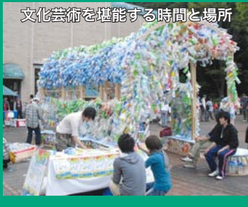
文化芸術を堪能する時間と場所