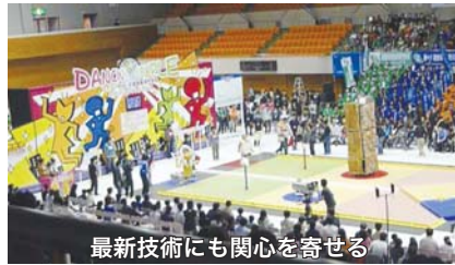
最新技術にも関心を寄せる

町田市議会で始めて、インターネット中継を提唱して実現させました。その成果を行政にも導入させ、透明な政治を提案していきます。「ばら撒き政治」とは一線を引いた良識ある保守の立場を取り、無党派と協調した活力と自立を支援する政治をめざします。