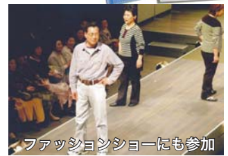
ファッションショーにも参加