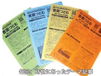
毎回、時世にあったテーマ記事

2週間に1回、B5サイズ両面印刷で発行。町田市政や生活情報まで取材し、幅広い情報発信。アンケート欄を設けており、いつでもFAXでご意見を募集しています。