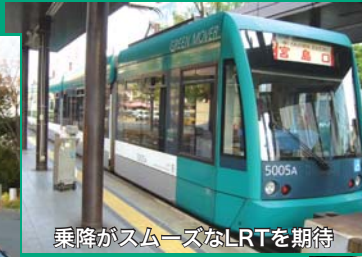
乗降がスムーズなLRTを期待