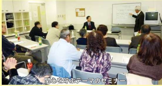
関心を呼ぶテーマのセミナー

無所属保守ネットワークを求める。現在、自民党を離党し、どの既成政党にも属さず、個人と無党派の視点に立つ。無所属で都議選に立ち、20,348人の支持を受けるが及ばず。新たな声援を受け、政治の原点に立ち返り活動中。ユーチューブ「発見動画チャンネル」を運営。過去、市議選連続4期当選し、ネット中継を提唱し実現。九州は博多の出身。長年、民間企業営業職社員として全国を飛び回る。その後、国会・都議会秘書等、多数の職業を経験。