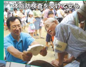
体脂肪検査を受けて安心